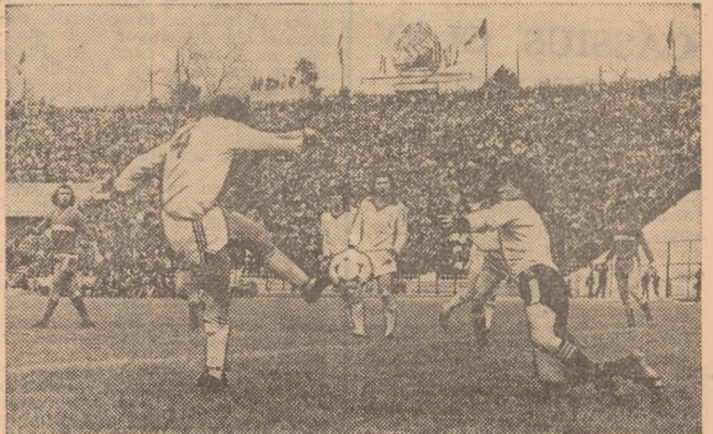
O fază din meciul retur dintre Dinamo și Progresul-Vulcan, de care iubitorii fotbalului își amintesc cu plăcere pentru spectacolul oferit.