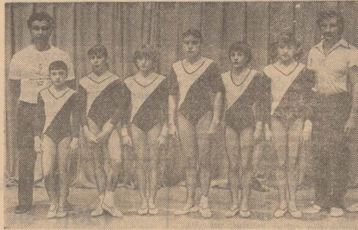
Gimnastele de la C.S.S. Onești — campioane ale „Daciadei“

Ca și la marile concursuri, grupa care avea să desemneze campioanele a fost programată în reuniunea de seară, astfel