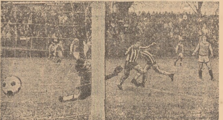
F.C.M. Brașov, la București, în fața Sportului studentesc (etapa a 20-a), primind golul care va marca evoluțiile diametralt opuse ale celor două echipe în retur

În retur, metodologia pregătirilor a rămas firește aceeași. S-a schimbat însă starea de spirit a jucătorilor, cu psihic neastentat de labil, gata să cedeze la primul esec. Etapa a XXV-a, cu înfrîngere acasă, în fața lui S.C. Bacău, a zguduit atît de tare echipa, încît curba descendentă nu s-a mai redresat pînă la sfîrșitul campionatului. (Mai mult, ea a fost coborîtă într-un ritm galopant...) Motivurile s-au dovedit, în plus, și numeroasele accidente, ca și decalajul dintre titlu-