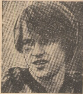
Vladimir Poliakov, primul săritor sovietic recordman al lumii la săritura cu prăjina