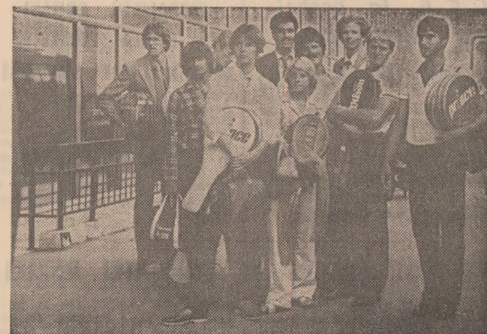
O parte a delegației universitare din S.U.A. la sosirea pe aeroportul Otopeni