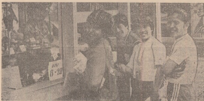
După orele de antrenament, gimnastele japoneze își completează colecțiile personale de păpuși și amintiri cu splendide obiecte de artizanat românesc, la toneta din Satul Universiadei.

Este proaspăt absolvent al Universității Nihon, unde a fost încadrat ca asistent. Măsoară 1,60 m și concurează la categoria 57 kg.