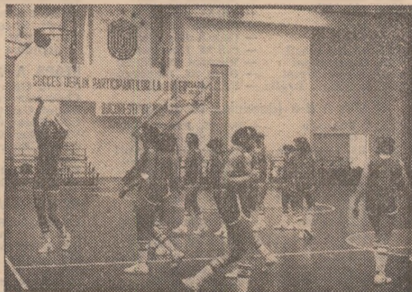
Baschetbalistele române la ultimul antrenament

La „Politehnica” lucrau de zor selecționatele studentesti ale Uniunii Sovietice. Printre componentele formației feminine am remarcat și pe campioanele olimpice Olga Sukarnova, Ludmila Rogozina și Olga Korosteleva. Ele, împreună cu celelalte coechipiere efectuau diferite scheme tactice de atac. La co-