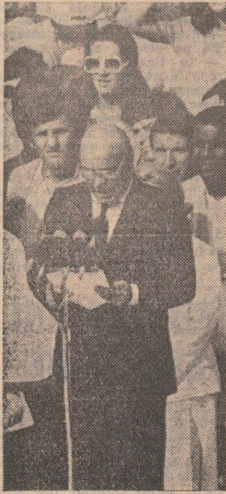
Dr. Primo Nebiolo, președintele F.I.S.U., rostindu-și alocuțiunea.