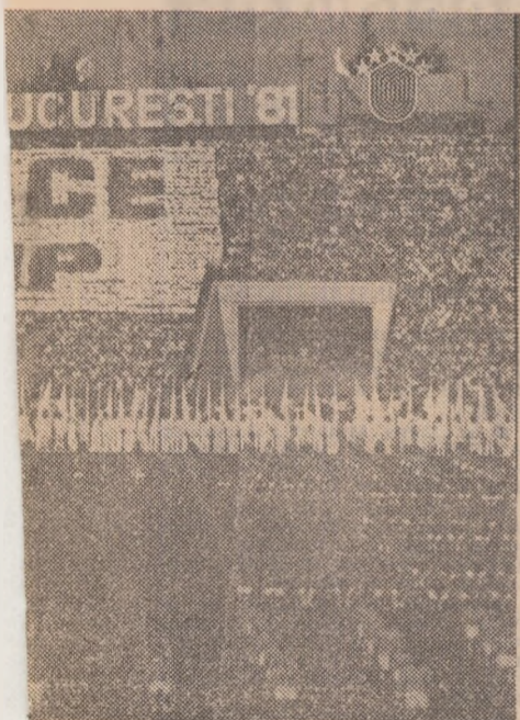
Delegația Republicii Socialiste România, în timpul defilării de ieri.

al al ce- erii Jocu- une, sute iau zborul vestind rile mon- vară 1981