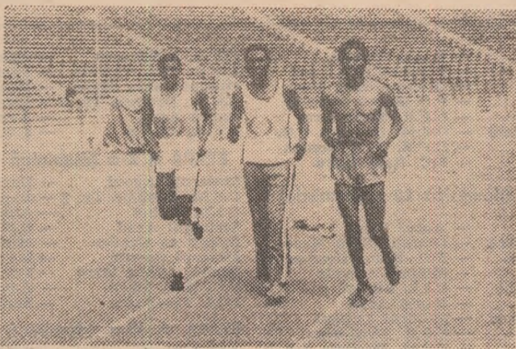
Atleții congolezi la primul contact cu pista de concurs