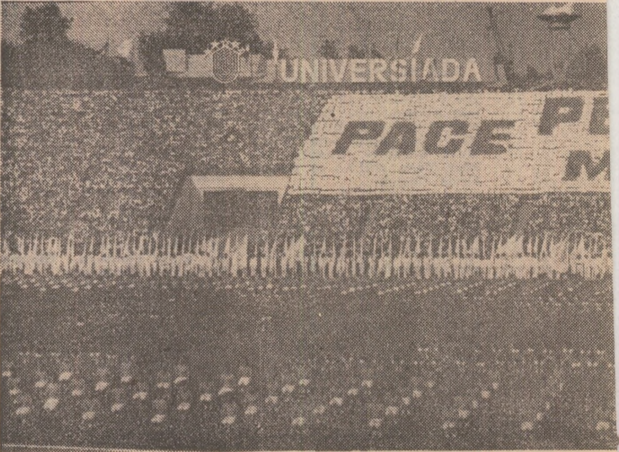
Unul din momentele cele mai frumoase ale grandios...

Grupuri de pionieri și tineri au oferit frumoase buchete de flori. Multipla campioană olimpică și mondială Nadia Comăneci și cunoscutul luptător Ion