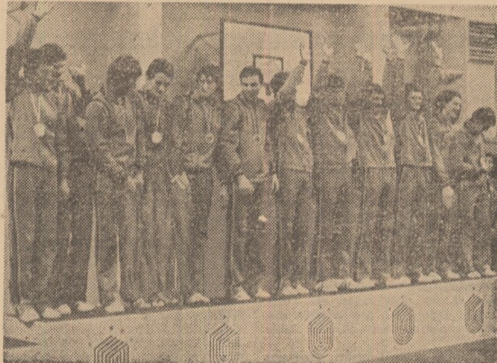
Din nou victorioasă, la înălțimea tradiției — echipa de volei a României.

Frumoasa poveste a Universiadei '81 e încă vie în memoria tuturor. Am putea spune că impactul afectiv al U-