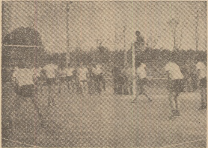
Meci de volei, pe terenul de pe baza „Triunghi” în cadrul „Cupei Eliberării”, la care au luat parte zeci de echipe de fotbal, volei, tenis de cîmp și de masă...

între ele, la fotbal, volei, handbal, șah și tenis de masă. În aceste zile, asociația sportivă „Arieșul” a autobazei pregătește meciul său anual cu „Arieșul-Turda”, performera din „Cupa României”. La marginea de sud-est a orașului s-a început construirea unei baze sportive moderne, dar despre ea vă voi vorbi, mai bine, cînd va fi gata... Aș vrea să închei cu ceea ce am început: „Daciaada” a scos Cimpenii din anonimul sportiv, creînd tineretului larg cîmp de acțiune. Ea a condus la schimbări importante, pe plan social, în viața moșilor.