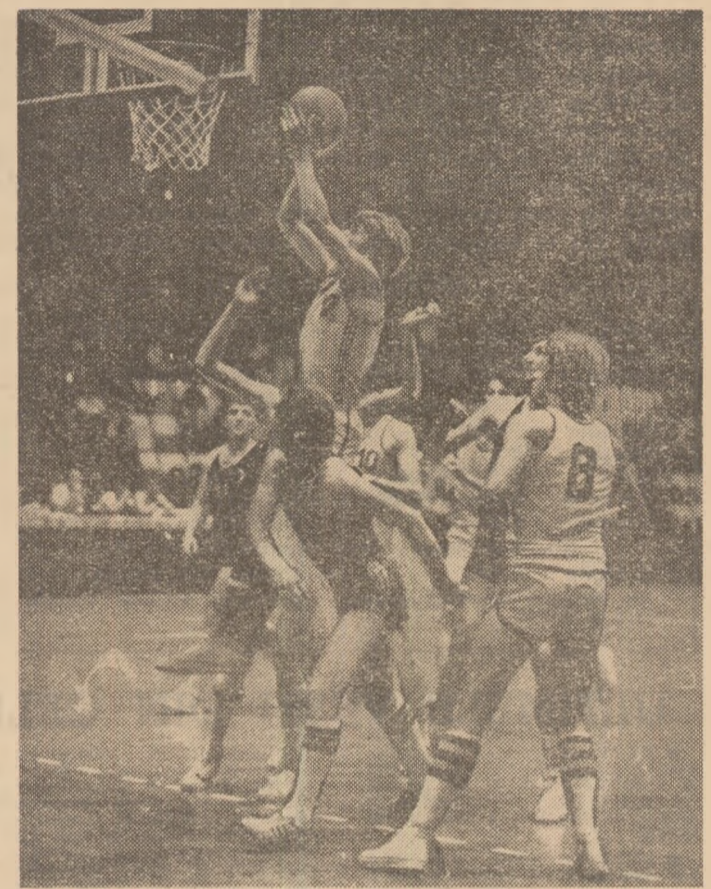
Inaugurată cu prilejul finalelor „Daciadei“, sala Rapid a gazauit spectaculoase meciuri de baschet. În imagine, fază din întîlnirea dintre selecționata Bucureștiului — câștigătoarea întrecerii — și echipa județului Cluj

O asemenea afirmare plenară a performerilor de mîine — cum lasă a se întrevădea trecerea în revistă dinainte — nu poate fi concepută decît în condițiile creșterii numărului de participanți la finalele „Daciadei“. Dacă am cumula cei 21.000 de participanți înregistrați la etapa de iarnă cu masa importantă de participanți preliminari pentru întreaga etapă de vară, vom ajunge la un impresionant total de peste 50.000 de sportivi de performanță, cifre care vorbesc de la sine despre nivelul atins de mișcarea