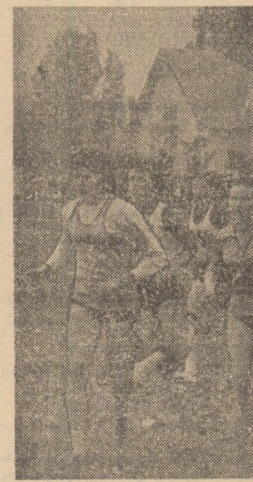
Crosurile au cunoscut sub însemnul „Daciaada” o astfel de competiție de

— Păi cum ar putea fi altfel? a zis zîmbind tovarășul Golea. Toată povara oboselii se duce cînd e vorba de sport. Aici, pe aceste terenuri, li așteapă cel mai bun prieten: „Daciaada”.