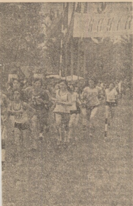
aspîndire. Iată o imagine sugestivă de la Blaj, pe Cimpia Libertății...

Grupaj realizat de: Victor BANCULESCU, Aurelian BREBEANU, Radu TIMOFTE, Sever NORAN, Traian IOANIȘESCU, Geo RAETCHI și Vasile TOFAN