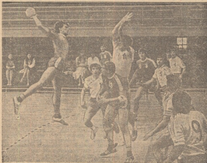
Fază din meciul Steua - Relon Săvinești. Stîngă (Steua) se înalță impetuos și va marca cu toată opoziția adversarilor.