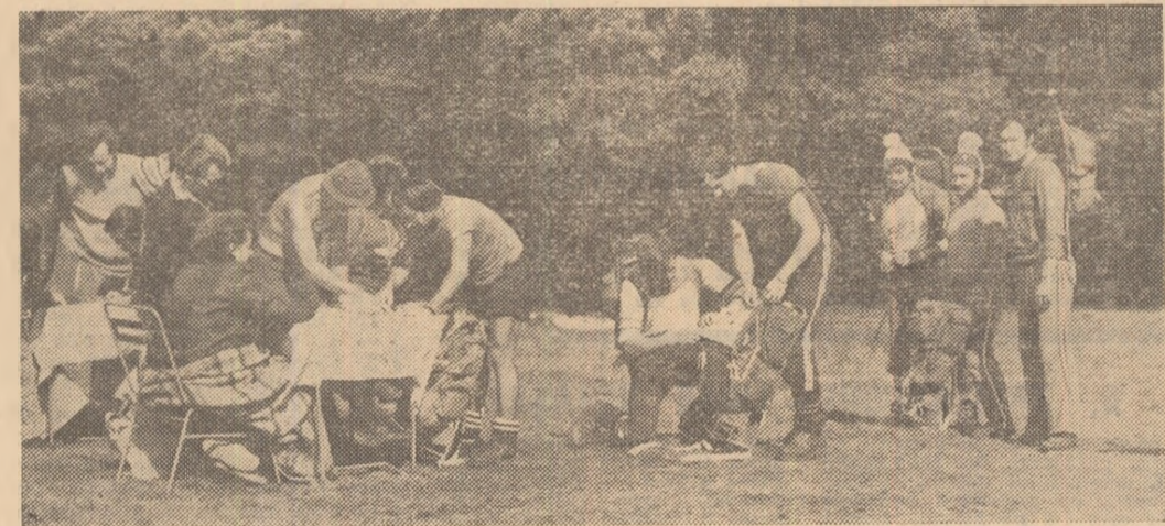
La punctul de start: șeful de echipaj primește harta cu traseul, în timp ce coechipierii săi își fixează numărul de concurs pe raniță

tele Roșu reprezentativele județelor de munte (Argeș, Sibiu, Brașov, Harghita, Neamț, Prahova etc.), dar și cele de cîmpie (ca Dolj, Teleorman sau Tulcea). Pentru prima oară și-au trimis reprezentanții județele Cluj, Alba și Botoșani. Dar, în afară de reprezentativele de județ, au fost prezente peste 70 de echipe ale cercurilor de turism din țară sau ale unor departamente. Pe platoul