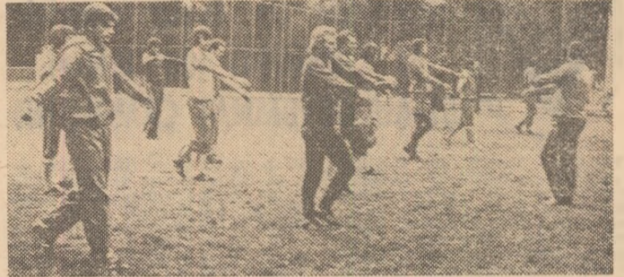
Componenții lotului reprezentativ efectuând un exercițiu de gimnastică în timpul antrenamentului de ieri dinineastă. Amănunte în pag. 2-3.