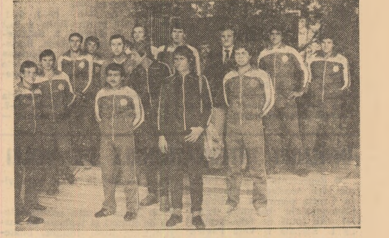
Fotbalștii bulgari în fața hotelului Dorobanți, înaintea plecării la antrenament.