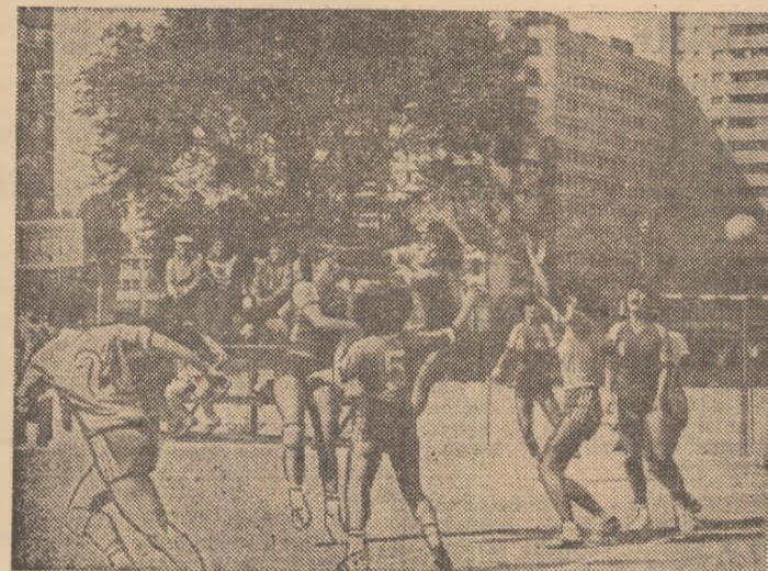
Inaugurarea noului complex de handbal al C.S.S. 2, situat în Pantelimon, s-a făcut, firește, prin aprige partide.

ganelor de partid și de stat ale sectorului II — adaugă an de an noi terenuri bazei sale materiale, marea majoritate prin munca voluntară a elevilor, părinților și profesorilor. Pentru ca situația să fie și mai clară, iar responsabilitățile evidente, s-a hotărît ca fiecare catedră, fiecare profesor sau antrenor în parte să răspundă direct de gospodărirea echipamentului și a terenurilor, de îngrijirea și buna lor administrare, precum și de organizarea și desfășurarea taberelor de pregătire organizate pe timpul vacanțelor școlare. Este, deci, o implicare directă a tuturor