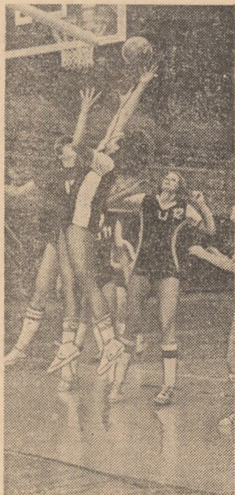
Dispută aprigă sub panou în meciul „U” Cluj-Napoca - Mobila Satu Mare.