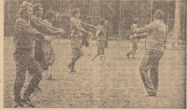
Exerciții de intrare în efort efectuate de selecționabili înaintea antrenamentului

Joi după-amiază, toți jucătorii s-au reunit în cadrul unei lecții de pregătire cu caracter tehnico-tactic, exersind cu prioritate combinațiile de bază și specifice determinate de cunoașterea adversarului de sîmbătă, echipa Elveției, al cărui joc a fost privit și analizat în diferite ipostaze ale ultimelor sale partide, la T.V., de selec-