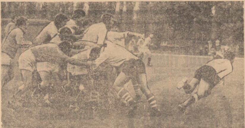
Fază din meciul R. C. Sportul studențesc - Farul Constanța (6-15)

concretizează o frumoasă acțiune (eseu), din acest moment Dinamo slăbind ritmul, jocul desfășurîndu-se între cele două linii de 22 m. Bandula ratează două l.p. în min. 34 și 37, apoi (min 38) Peter nu reușește să puncteze din drop la o frumoasă fază de atac. Sînt momente bune ale timișorenilor, însă Voinov și Radu ratează