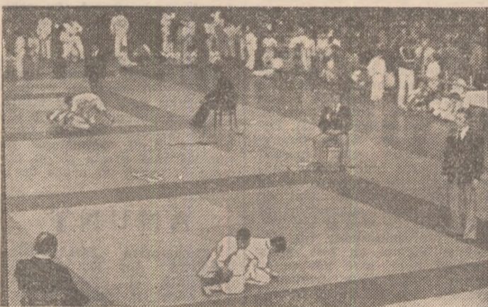
Aspiranții la titlurile de laureați ai celui de-al II-lea Festival național pionieresc de judo de la București, în plină întrecere.

Reuniți în sala Floreasca din Capitală, sub egida marii competiții sportive naționale „Daciada“, cei mai mici sportivi participanți la a II-a ediție a Festivalului național pionieresc de judo, reprezentanți a 19 județe și ai municipiului București au demonstrat, și de data aceasta, frumusețea unei discipline sportive care cerește continuu masele de copii din țara noastră. S-a verificat, și cu acest prilej, receptivitatea purtătorilor cravatei roșii cu tricolor „față de o întrecere a ambiției de a deveni autentici voinici“, cum remarca, pe bună dreptate, prof. Anton Murariu, secretarul responsabil al federației de specialitate.