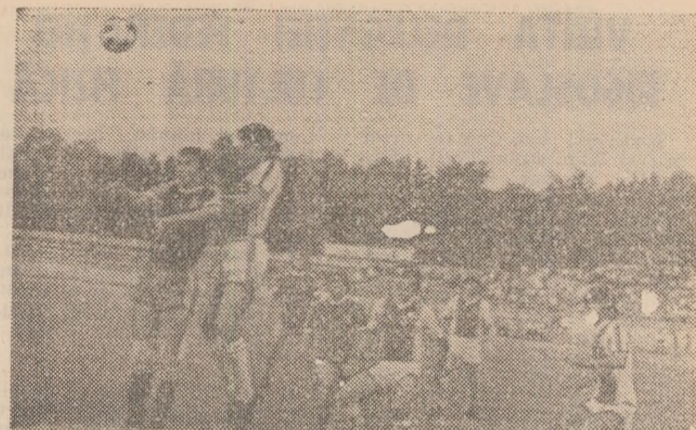
Apărarea brașoveană grupată, la post, respinge un atac aerian advers. Fază din meciul Dinamo — F.C.M. Brașov.

Minusurile formației brașovene apar, desigur, într-o măsură mai mică sau mai mare, la toți factorii jocului, dar sînt preponderente pe plan tehnic. Sigur că aceasta ține și de valoarea individuală a jucătorilor, ciștigurile sub acest raport fiind mai greu de realizat, cu prețul unor mari eforturi în pregătire. Dar, se pare că tocmai această tehnicitate mai redusă a lotului, oarecum în discordanță cu marea abilitate în manevrarea balonului dovedită de cei doi antrenori, N. Pescaru și I. Alecu,