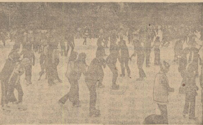
Instantaneu, elocvent, pe patinoarul Floreasca din Capitală