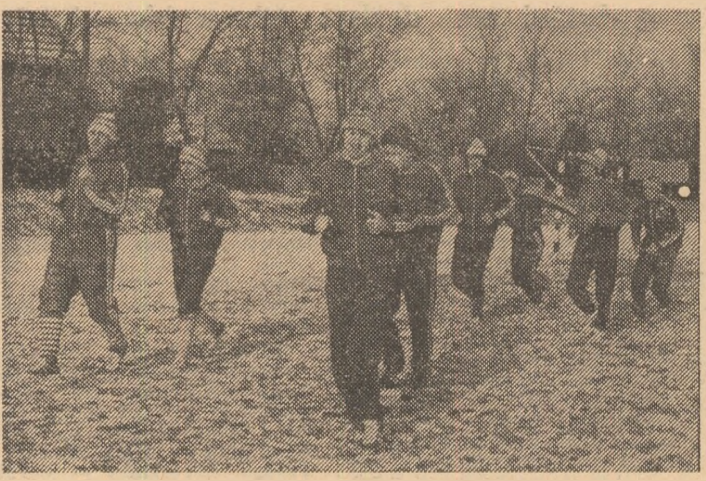
Jucătorii Sportului studențesc în plină alergare. Secvență de la unul dintre antrenamentele „alb-negrilor”.

Reîntîlnire cu fotbalul pe viu! S-au dus zilele vacanței și fotbalistii au apărut pe terenurile înzăpezite cu multă poftă de muncă, angajîndu-se voioși în programele de antrenamente. Divizionarele „A” străbat o perioadă care — lu- cru atît de clar dovedit — prezintă o importanță esențială pentru o comportare bună pe întregul an competițional. Inau- gurăm popasurile noastre, prin- tre cele 18 concurențe din pri- mul eșalon, cu Sportul studen- țesc. Grăbiți (și bine au fă- cut!), jucătorii bucureșteni s-au întîlnit încă de la 5 ianuarie. În ziua cînd i-am vizitat aveau de acum 17 zile de pregă- tire la activ. Marea majoritate a perioadei de pregătire se desfășoară la București, doar unele antrenamente fiind pro- gramate la Snagov, unde antre- norii I. Voica și M. Țițeica, cu jucătorii lor, efectuează lec- ții demonstrative pentru parti- cipanții la cursul de calificare a antrenorilor.