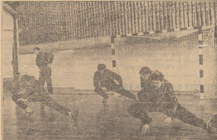
O parte dintre membrii lotului masculin de handbal la antrenamentul de ieri