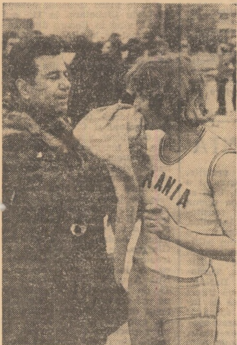
La Velenje, cu soțul și antrenorul Ion Puică, după crosul cîștigat înaintea fainoasei Grete Waitz...

Maricica Puică este singura atletă din lume al cărei nume este prezent în patru probe pe listele celor mai bune performere mondiale ale anului 1981. Ea s-a dovedit prima la 3000 m, cu 8:34,40 (record personal),