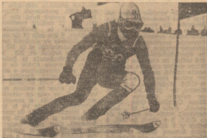
Pe pirtia Lupului, în plină cursă!

POIANA BRAȘOV, 19 (prin telefon). Întrecerile de schi din cadrul „Cupei Dinamo” au început sub cele mai bune auspicii. Concursul a fost deschis de băieți, care și-au disputat întietatea în cursa de slalom uriaș. Întrecerea s-a desfășurat pe pirtia Lupului, pe un traseu cu 45 de porți. Au luat startul 57 de schiori, care și-au disputat cu ardore primele locuri ale clasamentului, în cele două manșe ale probei.