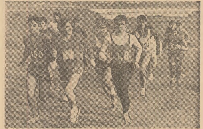
O secvență din întrecerea de cros organizată ieri dimineață pe baza sportivă Metalul din Capitală și dotată cu „Cupa Unirii”

În întreaga țară, copii, elevi, tineri din întreprinderi și instituții au ținut să marcheze, prin însuflețite întreceri sportive, aniversarea a 123 de ani de la istoricul act al Unirii. Iată cîteva dintre relatările primite de la corespondenții noștri.