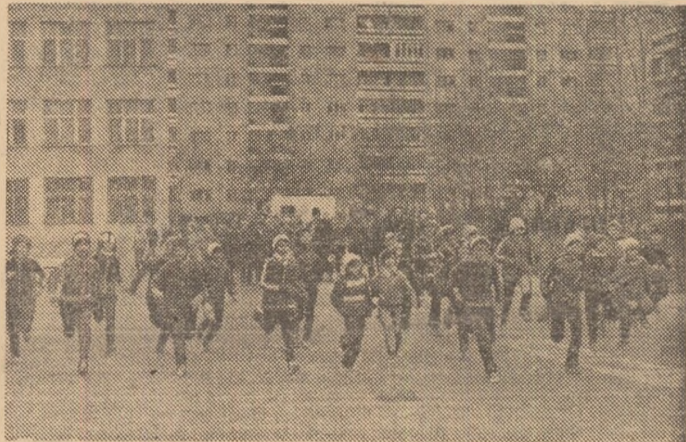
Vremea frumoasă a declanșat în unele locuri și întreceri specifice... primăverii: crosurile. Iată-i pe elevii din clasele 5—8 ale școlii generale nr. 75 la primul lor start în acest an

SIBIU. Șoimii patriei din calitate au fost prezenți la