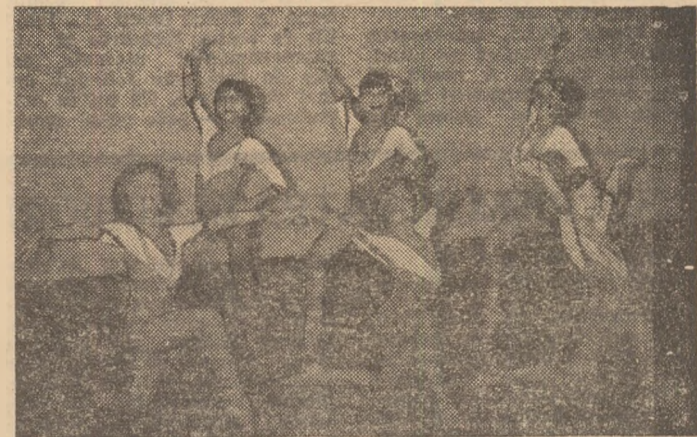
Echipa de gimnastică ritmică modernă a întreprinderii, care a câștigat titlul de campioană națională la categoria celor mai mici... „artiste”, execută un grațios „tablou”