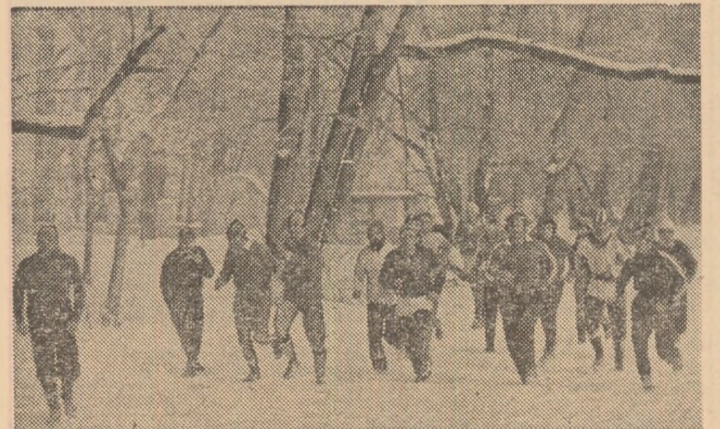
Rugbyștii noștri fruntași pregătesc, în aceste zile, viitorul sezon. În imagine, jucătorii sibieni, la unul dintre antrenamentele desfășurate în parcul Sub arini.