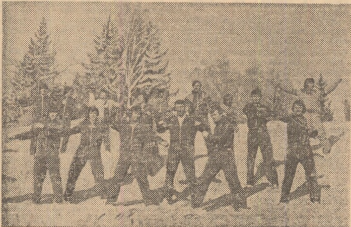
Antrenamentul începe cu o „încălzire” absolut necesară înainte intrării, din plin, în efort