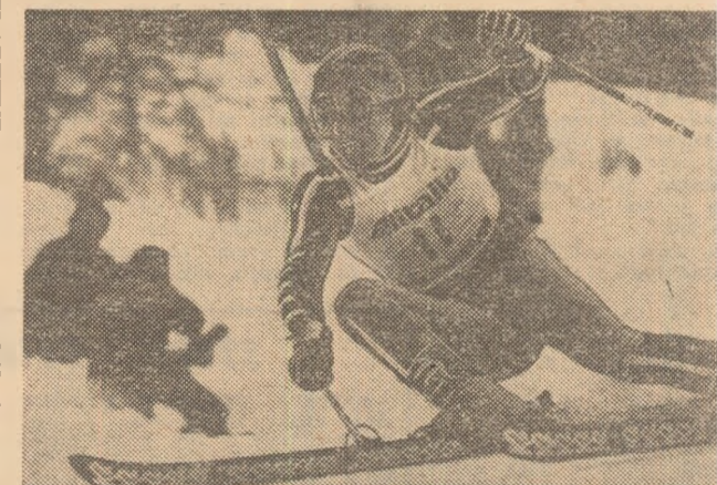
Americanul Phil Mahre — lider autoritar și virtual câștigător (pentru a doua oară consecutiv) al „Cupei Mondiale“ la alpin.

Copenhaga (Danemarca) ● Campionatele mondiale de patinaj artistic vor avea loc în localitate între 9 și 14 martie ● Meciul de hochei Danemarca — Franța a revenit gazdelor cu 6-4 (1-2, 2-1, 3-1). Minsk (U.R.S.S.) ● Proba de 20 km din cadrul C.M. de biatlon a revenit lui Frank Ullrich (R.D.G.) cu 1.07:17,03. El a fost urmat de Erik Kvalfoss (Norvegia) 1.07:50,39 și Terje Krostad (Norvegia) 1.10:40,60.