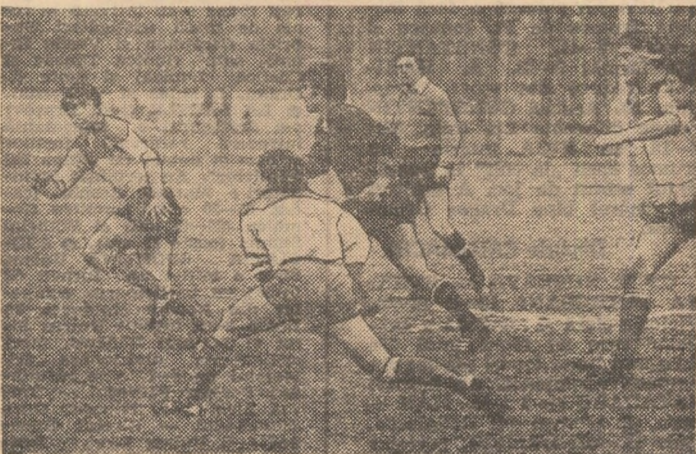
Rugbiștii dinamoviști în vervă, lansează un nou atac spre burta echipei Sportul studentesc