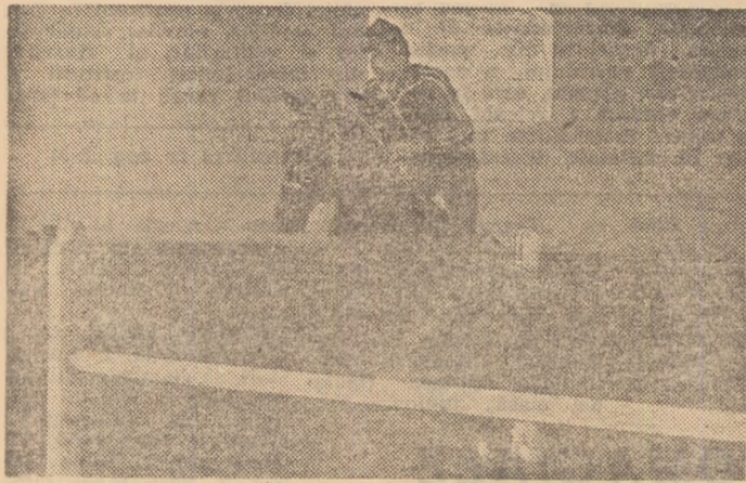
Aspect din proba de călărie disputată ieri