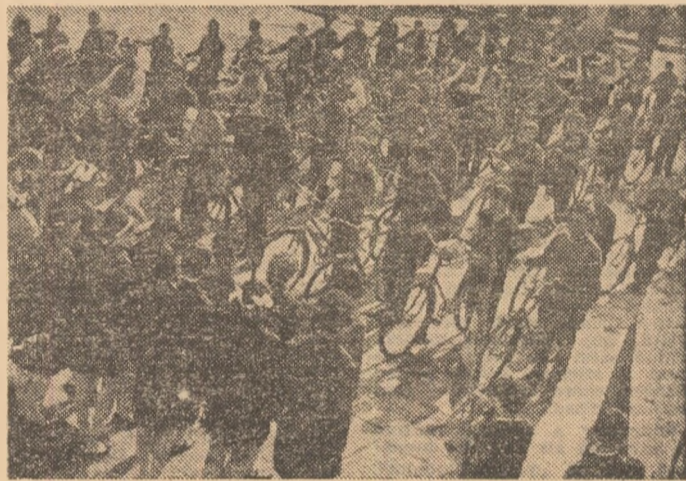
Cea de a doua „recreație” a anului școlar, de obicei cu multe zile însoțite, este o invitație la drumeții și excursii, la cicloturism de masă...

nua și desăvîrși pregătirea în disciplina îndrăgită. Astfel, elevii atleți vor face popas de tabără la Baia Mare (210 elevi), Căprioara — Tîrgoviște (170) și Mangalia (80), canotorii la Timișoara (140), caiacisții și canoistii la Orșova (90). Tot la Mangalia vor fi pre-