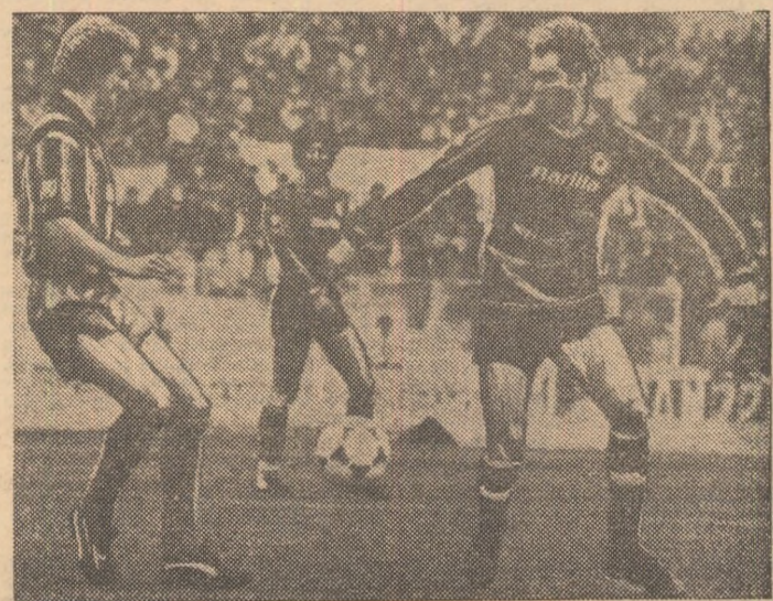
Acești doi celebri jucători vor fi adversari și la „El Mundial”? Este vorba de austriacul Prohaska (stînga) și de brazilianul Falcao, care joacă acum în campionatul italian: primul la Inter, celălalt la Roma.