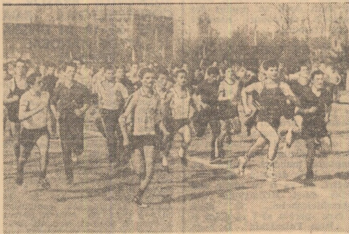
Crosurile de masă constituie un minunat prilej de mișcare în aer liber

Rezultă că startul, așteptat peste tot cu mare interes, va fi urmat de concursuri în cadrul „Cupei Costești” la handbal și volei, „Cupei siderurgistului” și „Cupei minerului” la fotbal, competiții ajunse acum la XI-a ediție. În același timp, în atenția tineretului hunedorean se află și festivaluri cultural-sportive specifice unor zone ale județului, „Nedeia Vulcăneană”, „Mureș pe marginea țării” sau „Vine Streiu de la munte”; nota folclorică a acestor festivaluri apare dominantă. Sigur, toate aceste acțiuni sportive debutează cu