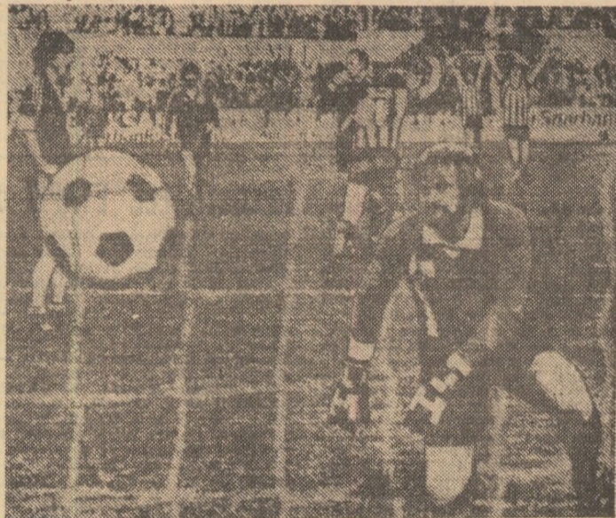
I.F.K. Göteborg deschide scorul prin Holmgren în returul semifinalei Cupei U.E.F.A., cu F.C. Kaiserslautern (2-1). În poarta echipei vest-germane... suedezele Hellström privește decepționat.

Dortmund. Prima ediție a competiției masculine „Cupa federației” s-a încheiat cu victoria echipei vest-germane VfL Gummersbach care a dispus de formația iugoslavă Zveznicar Sarajevo: 23-14 (9-4).