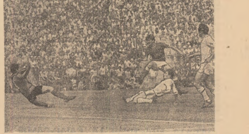
Damaschin înscrie cel de al doilea gol al Rapidului.

gerat în raport cu desfășurarea jocului, giuleștenii vor umbrî însă finalul meciului printr-o nesportivă plimbare a balonului în propria lor jumătate de teren. Arbitrul R. Petrescu (din Brașov) a condus bine următoarele formații: