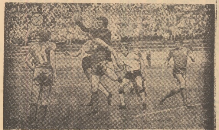
Aiac periculos al studenților bucureșteni rezolvat, cu dificultate, de apărărea mureșeană. Fază din meciul Sportul studențesc — A.S.A. Tg. Mureș.