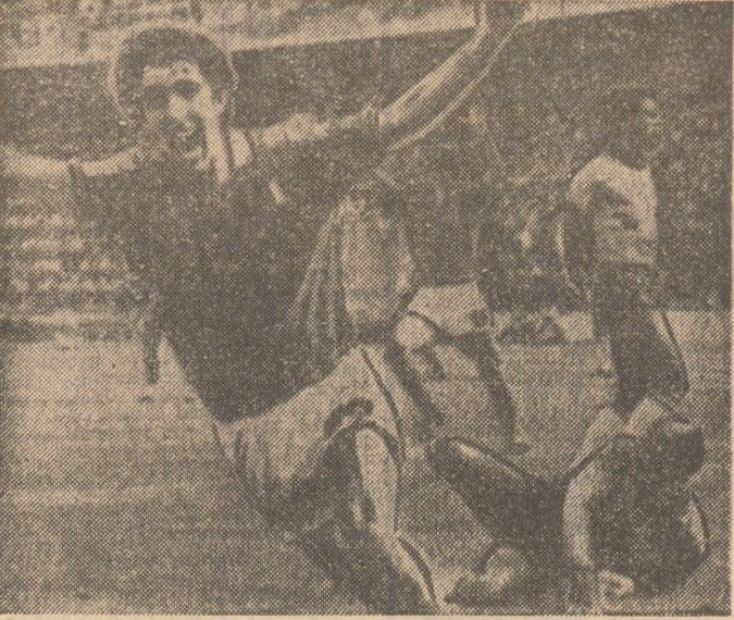
Paolo Rossi este fericit: a deschis scorul în meciul decisiv cu Brazilia

La jocurile din serie, Rossi, de asemenea, n-a fost în largul lui, ca altădată, dar Bearzot a continuat, cu încăpăținare, să-l folosească. Și iată că, luni, în cel mai important meci al Italiei la actualul C.M., în partida cu Brazilia, marea favorită a competiției, Paolo Rossi a jucat excelent (se spune că la cel mai înalt nivel în cariera sa!). El a înscris toate cele 3 goluri ale echipei italiene și a mai ratat încă altele, contribuînd decisiv la calificarea „squadrei azzurra” în semifinalele campionatului!