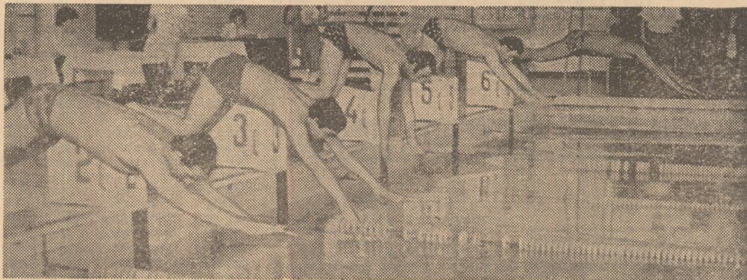
Start în proba de 100 m liber