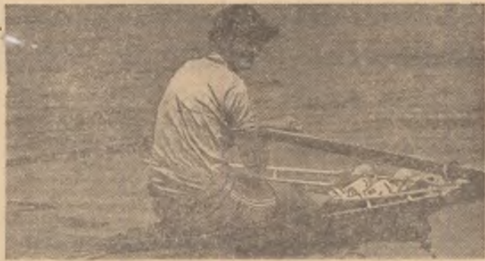
Un nou mare talent al schifului românesc — Elisabeta Oleniuc învingătoare ieri în finalele „Cupei Prietenia“.