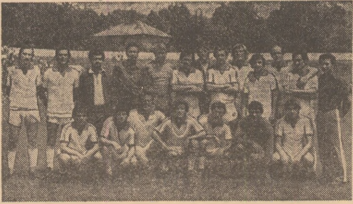
Întâlnire pe fotbaliștii ieșeni, pe antrenorii, medicul și masorul lor la câteva minute după ultimul joc... în divizia secundă.