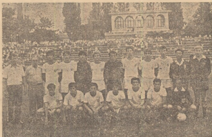
Juniorii noștri la câteva minute după victoria cu 2-0 din „finala mare”, disputată duminică pe stadionul Dinamo