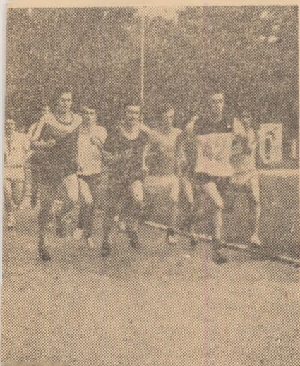
in crosul băieților...

sportiv... a... le, in... a com... ională, ...ctorul”. „Da... l Uni... dustria ...ctiune... i din... anti ai DE ală ite plecat la Vă... e vor... slavia”, elegați... onatele seriile După-a... ile. Vi... ută se... amiază i dumi... și fi... curse finalele