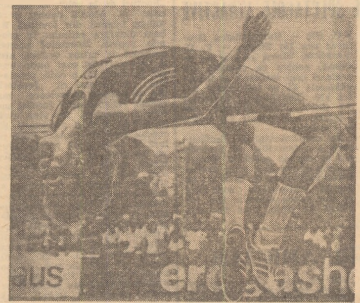
Ulrike Meyfarth, campioană olimpică în 1972 la săritura în înălțime, cu 1,92 m, a sărit recent 2,00 m, fiind a patra săritoare care a trecut peste această înălțime, după italianca Sara Simeoni 2,01 m în 1978, Rosemarie Ackermann (R.D.G.) 2,00 m în 1977 și Colleen Rienstra-Sommer (S.U.A.) 2,00 m în 1982 (sa'*)

MADRID, 27 (Agerpres) — După 11 runde și disputarea partidelor intrerupte în turneul interzonal masculin de șah de la Las Palmas (Insulele Canare), în clasament conduce fos-