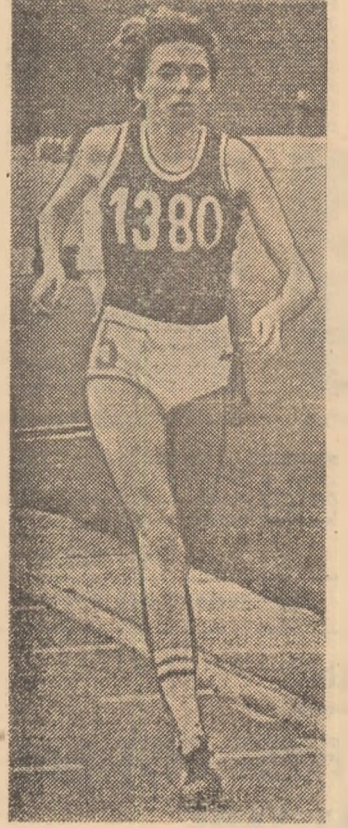
Doina Melinte, cea mai bună performantă mondială a sezonului la 800 m - 1:55,05.