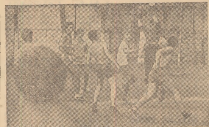
Multe întreceri în Parcul „Voinicelul” în aceste zile de vacanță. Dintre ele nu putea, desigur, să lipsească... fotbalul! Elevii școlilor din cartier semnează aici prezențe zilnice

judet se inițiază. În serii de cîte două săptămîni, în înnot, sub îndrumarea unor profesori și antrenori stabiliți de C.J.E.F.S. și Inspectoratul școlar judetean. De menționat că pentru pionierii care s-au evidențiat la învățură, în sport