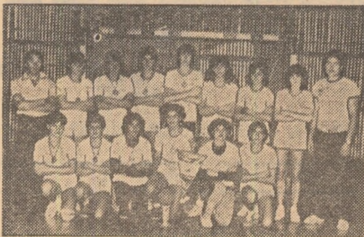
Formațiile Școlii generale nr. 2 Caracal (fete) și Școlii generale nr. 4 Baia Mare (băieți) — câștigătoarele trofeului „Cupa Pionierul“ la handbal

După întreceri disputate, atractive, cele mai bune formații s-au dovedit cele ale Șc. gen. 2 Caracal, la fete, și Șc. gen. 4 Baia Mare, la băieți. Pe primele trei locuri s-au clasat: FETE: 1. Șc. gen. 2 Caracal, 2. Șc. gen. 9 Galați, 3. Șc. gen. 12 Baia Mare. BĂIEȚI: 1. Șc. gen. 4 Baia Mare, 2. Liceul pedagogic Drobeta Tr. Severin, 3. Liceul „M. Eminescu“ Iași.