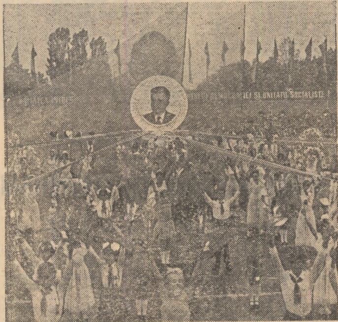
Demonstrează preșcolarii și pionierii, cele mai tinere vîrstare ale patriei și ale sportului românesc

Este momentul culminant al grandioasei sărbători, momentul în care toți cei ce trăiesc și muncesc pe aceste meleaguri străvechi — români, maghiari, germani și de alte naționalități — fac legămint de a acționa strîns uniți în jurul partidului, al secretarului său general, președintelui Republicii Socialiste România, tovarășul Nicolae Ceaușescu, de a nu precupeți nici un efort pentru transpunerea în viață a Programului partidului, a istoricelor hotărâri ale Congresului al XII-lea al P.C.R., pentru progresul și prosperitatea României socialiste, pentru înălțarea ei continuă pe noi culmi de civilizație și progres.