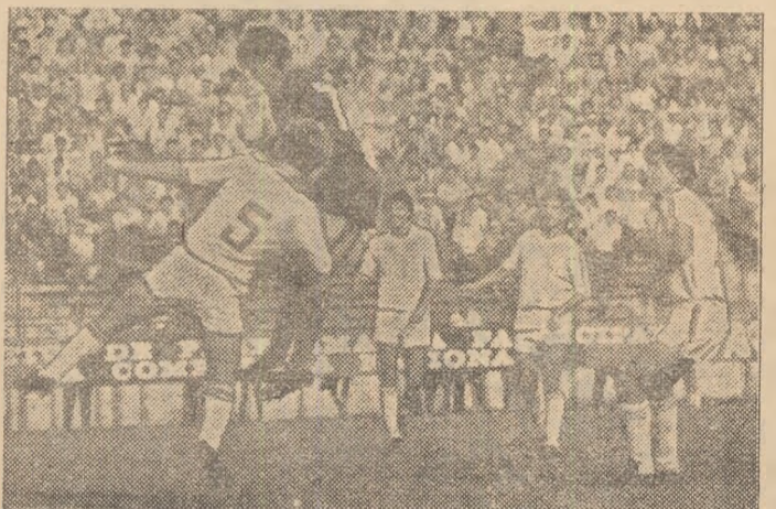
Intre 4 jucători băcăuani, Dorel Zamfir se înalță și trimite balonul cu capul, în plasă.