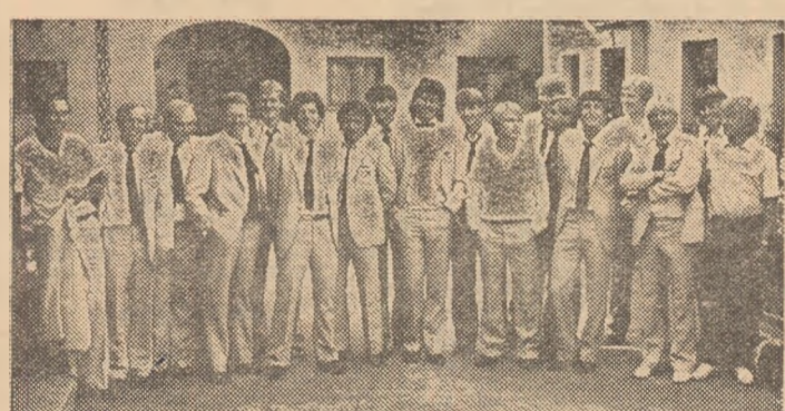
Iată-i pe fotbalștii norvegieni la sosirea în Capitală