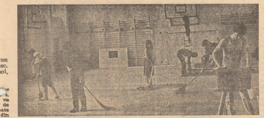
O imagine din sala de sport a Liceului Industrial 20, din Sectorul 6 al Capitalei, care poate fi întilnită, în aceste zile, în numeroase alte locuri din întreaga țară: sălile de sport, ca și terenurile, sînt pregătite pentru reîntîlnirea cu Școala...

Cea mai bună bază sportivă școlară din Bacău aparține Liceului Industrial 5: terenuri (bitum sau zgură) pentru handbal, volei, mini-fotbal, cu gard împrejmuit din fier forjat, plus o sală frumoasă. Car asemenea dotări se pot lauda și elevii Liceului „Vasile Alecsandri”. Al școlilor generale 10, 5, 28, 16 ș.a. Însă nu la fel putem scrie despre aspectul terenului Școlii generale 2 - plin de apă, de bălării, de prundiș; într-un cuvînt neîngrijit! La ce să folosească porțile de handbal cînd terenul este impracticabil? Totodată, credem că în această spațioasă curte se mai pot completa amenajări pentru sport. Dar cine să le facă? - Iată întrebarea. (I. Iancu, coresp.).