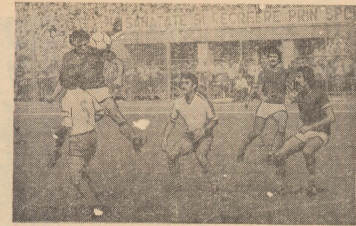
Fază din întîlnirea Metalul - Rapid (0-1), disputată ieri pe stadionul Republicii din Capitală.

CIMPIA TURZII, 5 (prin telefon) Pe un stadion devenit neîncapeător și pe o vreme frumoasă, meciul s-a ridicat la o bună cotă valorică, victoria revenînd, pînă la urmă, meritat, formației locale care s-a impus în marea majoritate a timpului de joc. În prima repriză (ceva mai echilibrată), gazdele au înscris câteva excelente situații de a deschide scorul prin Coloji (min. 4 și 45), Vlăduț (min. 16 și 40) și Mihătean (min. 23), în timp ce oaspeții au ratat prin Ene (min. 25 și 34). La reluare, doar în primele 10 minute formația bălmăreană a reușit să mai mențină echilibrul, după care a cedat pasul, inițiativă trecînd, aproape în totalitate, de partea jucătorilor din Cimpia Turzii. După ce în min. 52 Radu a expediat balonul în bară, și după alte câteva mari ratări ale lui Matyaș (min. 55) și Coloji