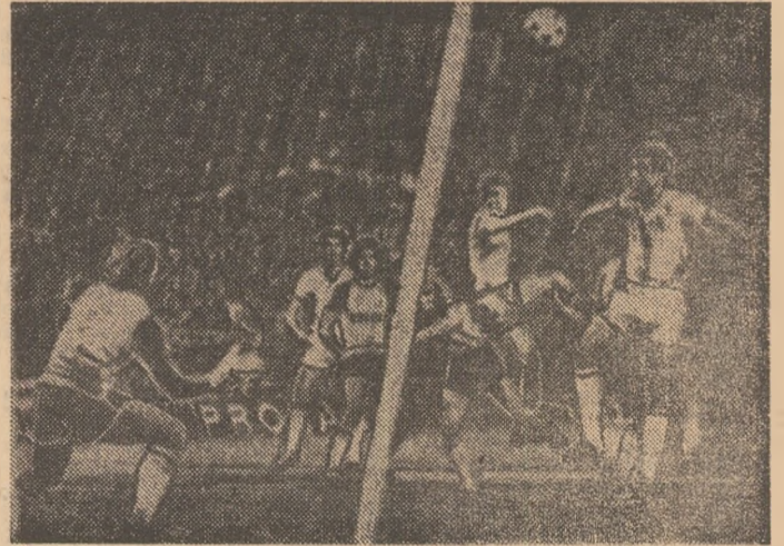
Fază din meciul care... se va rejuca: A.E.K. — F.C. Köln (3-3), Klaus Fischer (în dreapta) înscrie primul gol pentru oaspeți.