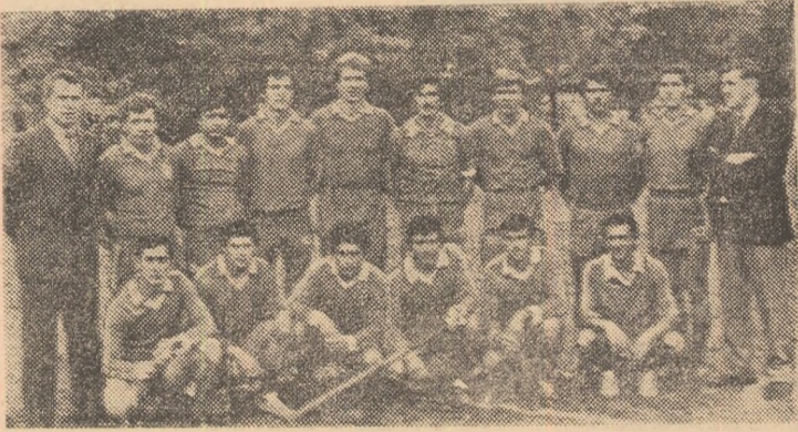
Oiniștii de la Dinamo București au îmbrăcat duminică pentru a 12-a oară tricourile de campioni ai țării.

de zile activitatea competițională, a furnizat — conform așteptărilor — un joc cu numeroase faze, aplaudate la scenă deschisă, considerat în unanimitate de specialiștii prezenți în tribune drept cea mai frumoasă întîlnire de foarte mulți ani. Desfășurată într-o înaltă înținută tehnică, această intracere a întrunit toate atributele unui derby, minuscula minge s-a aflat aproape în permanență în zbor, poposînd adesea peste linia de treisferturi sau de