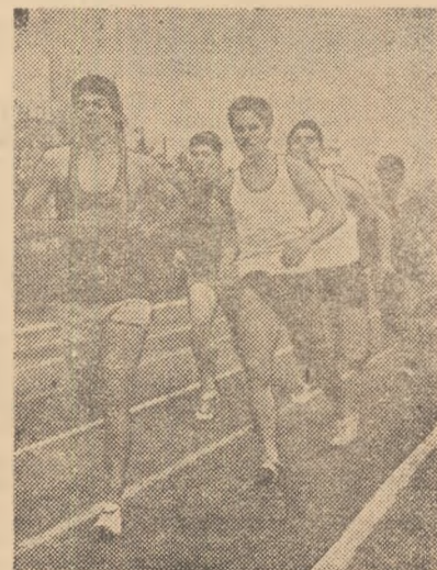
„Serie” la 800 m