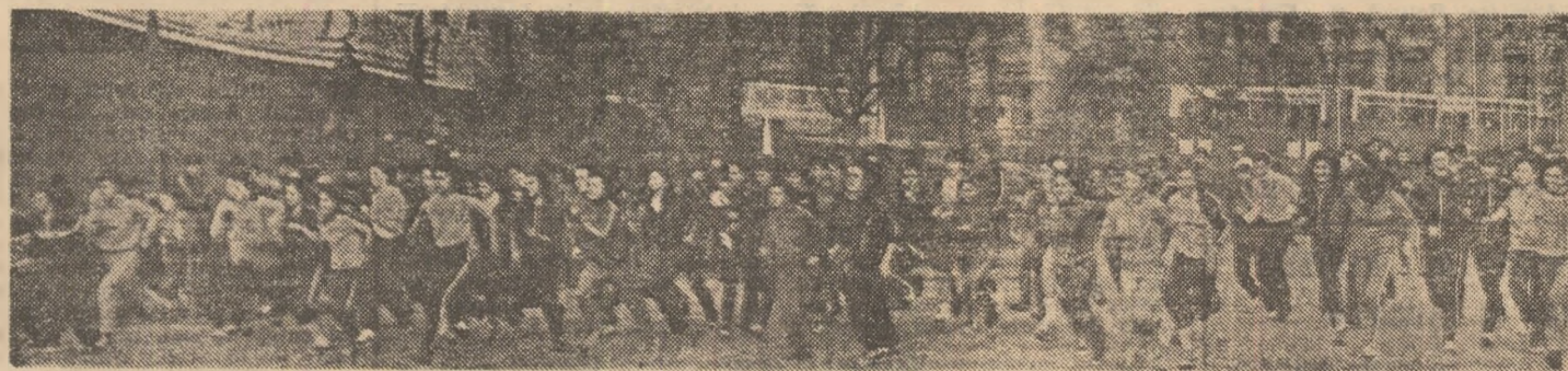
Secvență de la marea cursă din Parcul Tineretului

ieri, în Parcul tineretului din Capitală