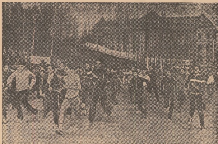
În decorul mirific al toamnei, ca și în acest început de iarnă, concursurile de cros au reprezentat o invitație la mișcare în aer liber pentru sute și mii de tineri din Capitală. Iată o imagine aproape cotidiană surprinsă de foto-reporterul nostru Dragoș Neagu în Parcul tineretului.

ticipând la ample manifestări omagiale organizate sub genericul „Daciadei”, pe stadioane și în sălile de sport, în parcuri și la locurile de turism și agrement. Prin participarea lor la un amplu evantai de competiții, prin performanțele realizate, ei țin să aducă un fierbinte prinos de recunoștință pentru grija părintească purtată de partid tinerii generații, ca ea să crească sănătoasă, viguroasă și fizic și intelectual. În pagina de față grupăm o parte din aceste acțiuni relatate de redactorii și corespondenții ziarului.