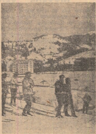
Borșa, perla montană a Maramureșului, oferă amatorilor de schi numeroase pante cu grad variat de dificultate.

Prin amabilitatea Serviciului prevederilor de securitate durată ale vremii din cadrul Institutului meteorologic hidrologic, aflăm grosimea straturilor de zăpadă din unele regiuni montane ale țării: Semele — 15 cm, Tarcu — 16 cm, Păltinș — Sibiu — 5 cm, Virful Omu — 3 cm, Babele — 12 cm, Sinaia — 7 cm, Toaca — 4 cm, Rarău — 9 cm, Vlădeasa — 2 cm, Băișoara — 11 cm, Sina de Vale — 15 cm. Se așteaptă ca la sfîrșitul săptămînii să cadă precipitații sub formă de lapoviță și ninsoare.