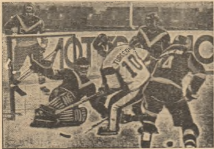
Aspect de la meciul Canada — R. F. Germană de la Campionatul mondial de juniori