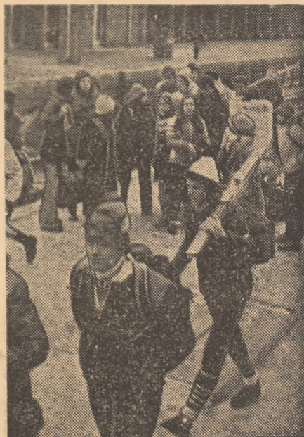
Un grup de elevi a coborît în Gara Sinaia...