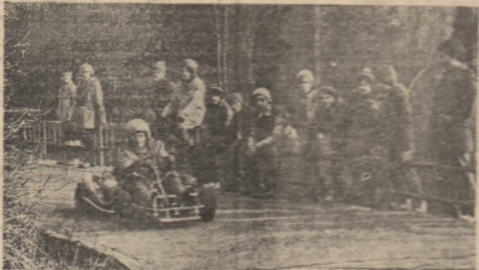
Sporturile tehnico-aplicative, pe placul tuturor copiilor

de Șubă merge... Dar nu, nu merge, ceva nu e în regulă, pufnesc în ris și întorc tabla cu pătrățelul alb în dreapta. Da, oricum, sint începători și cred că Florin Gheorghiu tot ca ei a început. Le dăm drep-