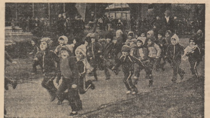
Cît sînt de mici, nu sînt la primul lor start.

Ce școli participă, tovarășii? Ni se enumeră: 10, 31, 28, 39, 77, 24, 56 și...etc. Facem o socoteală și reținem că de la fiecare școală au venit cam 10-15 elevi. Ne dăm cu părerea că sînt cam puțini. Da — ni se spune — dar să nu uităm mini-fotbalul, tenisul de masă și șahul, care se dispută la școala nr. 28, de peste drum. Nu-l uităm, dar parcă tot sînt cam puțini. Și soarele ăsta, care invită la joacă.