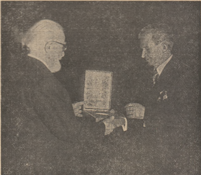
Tovarășului Nicolae Ceaușescu i se înmânează MEDALIA OMAGIALĂ instituită în mod special pentru secretarul general al partidului, președintele României socialiste